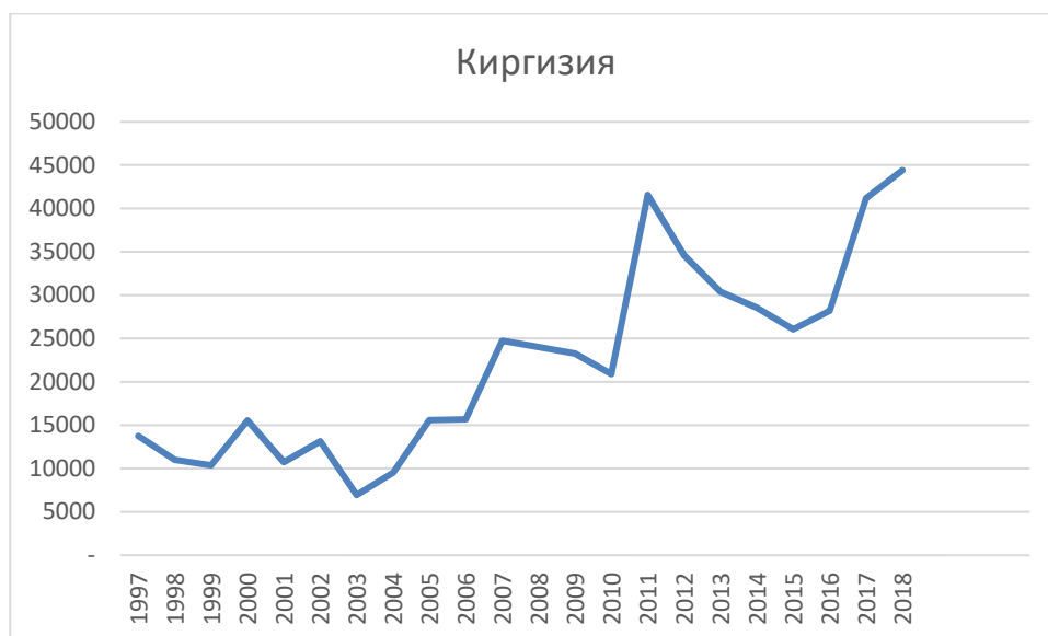
Рис. 1. Статистические показатели миграции в РФ