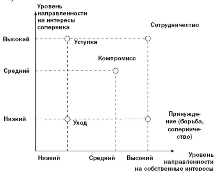
Рис. 1. Стратегии поведения в конфликте

- У вас есть время поработать над возникшей проблемой (это хороший подход к разрешению конфликтов на основе перспективных планов).